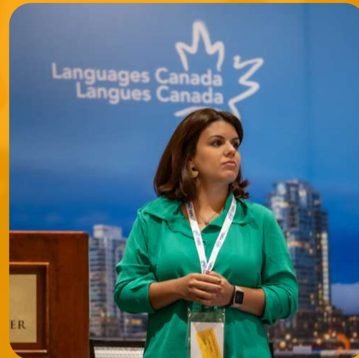
Languages Canada Vancouver