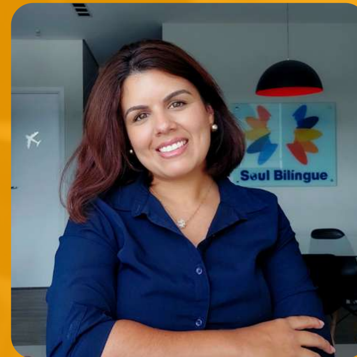
StudyTravel Star Award