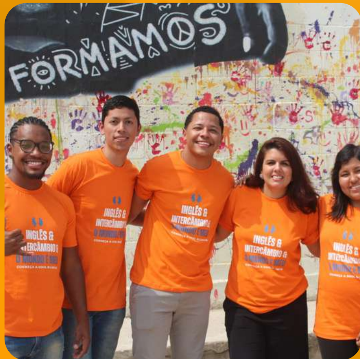
The Pie News London