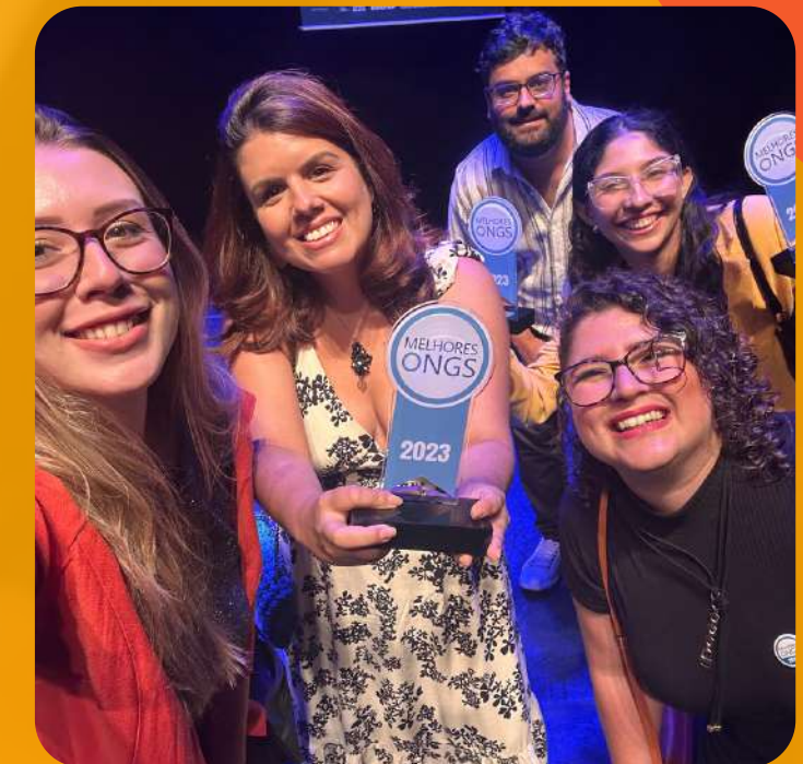
Best NGOs 2022-2023